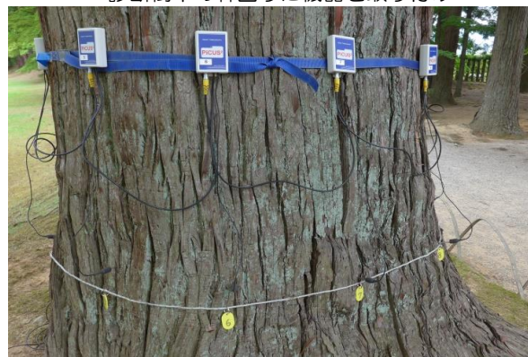
測定装置取り付け完了