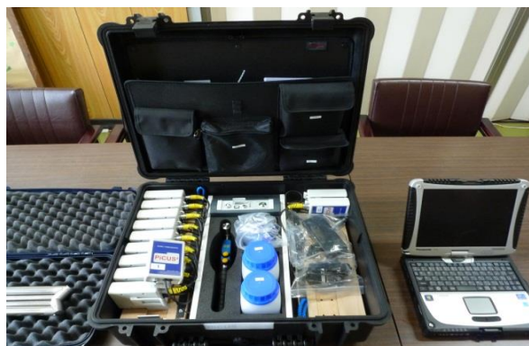
非破壊診断装置ピカス