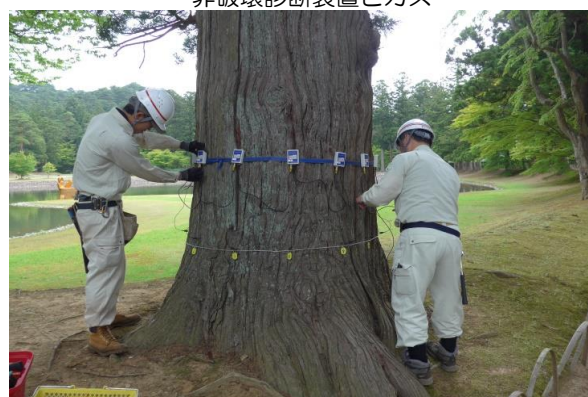
診断樹木の幹回りに機器を取り付け