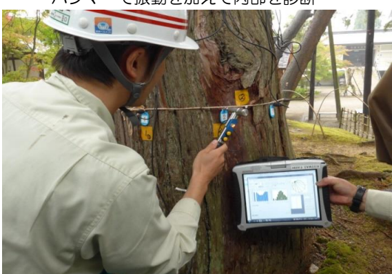
正しく診断されているかパソコン画面でチェック