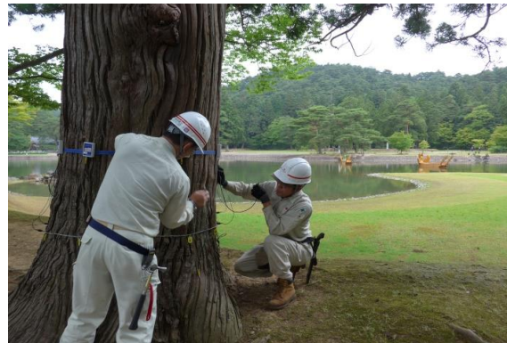
ハンマーで振動を加えて内部を診断