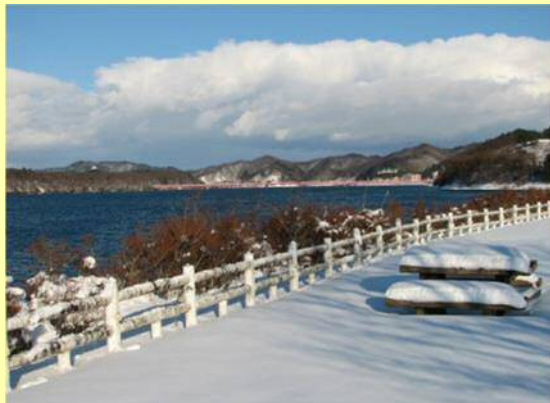
御所湖と雪景色(H23.12.26 除わんぱく広場より)