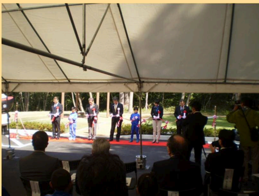
矢櫃地区園地開園式(H27.9.30)