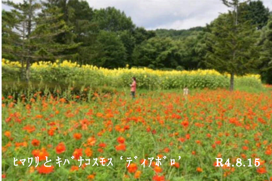
ヒマワリとキバナコスモス‘ディアボロ’ R4.8.15

この夏、お久しぶりね！といった行事が多かったのでその紹介です。まずは、7月31日の「御所湖まつり」(毎年七月の最終日曜日に開催)は、コロナ禍で中止が続き実に3年ぶりの開催。久しぶりに花火が夏の夜空と湖面を染め、たくさんのお客様が楽しめました。次は、ファミリーランド賢治の花壇での「ヒマワリ