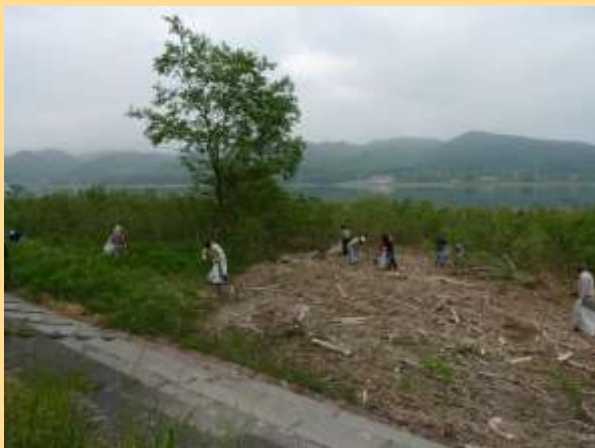
御所湖統一清掃(H24.6.3.塩ヶ森水辺園地隣接地内)