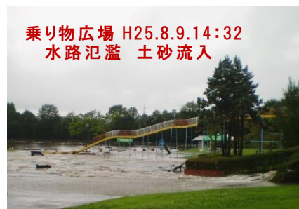
乗り物広場 H25.8.9.14:32 水路氾濫 土砂流入

8月が近づくと思いだすのが「平成25年8月秋田・岩手豪雨」です。岩手県央に、公園とその周辺に大きな被害をもたらしました。午前5時頃から降り始めた雨は午後1時頃には御所ダムへの流入水量が過去最高の毎秒3,733 m 3 を記録しました。筆者は乗り物広場から昼前に盛岡市内に出かけたのですが、帰路、いたるところで土砂崩れや道路の冠水があり、通行止めで廻り道を繰り返し、帰り着いたのは夕方となりました。当時の公園月報には「9日は記録的な大雨となり、乗物広場を流れる水路が氾濫するなど公園全般に甚大な被害となった。また、周囲の道路も寸断され湖岸の周回道路も4日間ほど一部通行止めとなった。このため、乗り物広場は当日および翌日を臨時休園、ファミリーランドも当日15時から休園とした。町場地区園地は当日一時閉門としたが、雫石町の依頼により、豪雨による足止めをされていた人の一時避難場所（トイレ等）として13時から17時まで開放し、26台の利用があった。」との記載があります。御所ダムは洪水時最高水位まであと1.28mに迫り、ダムが無ければ北上川と雫石川の合流点で約4m水位が上昇し盛岡市街地で約12,000戸の被害がでたと推測されました。またダムには流木やごみが25年分が流入したそうです。流木を補足することで、下流河川での被害も防ぐことができたとのこと、確かに、乗り物広場の中を流れる小さな水路も上流から流れてきた流木によりせき止められ氾濫し舗装が剥がれ、変わり種自転車のコースは10センチほど土砂が堆積するなどの大きな被害を受けました。つなぎ温泉も大きな被害を受け、温泉街の土砂などが流れ込んだ南園地（手つなぎ広場）は、土砂を取り除いた後も、臨時の災害ゴミ集積場所となり、駐車場が使えるようになったのは9月中旬のことでした。