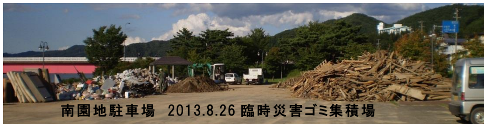
南園地駐車場 2013.8.26 臨時災害ゴミ集積場