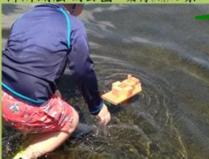
木で船を作ってあそぼう(R5.7.19 ファミリーランド)